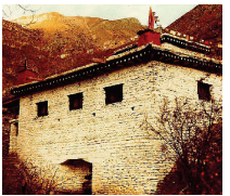
The "Temple Of Miraculous Fire" at Muktinath, Nepal. Photo by Ken Street (Nov. 1979).

[For more on this subject, please read our tract The Temple Of Miraculous Fire .]